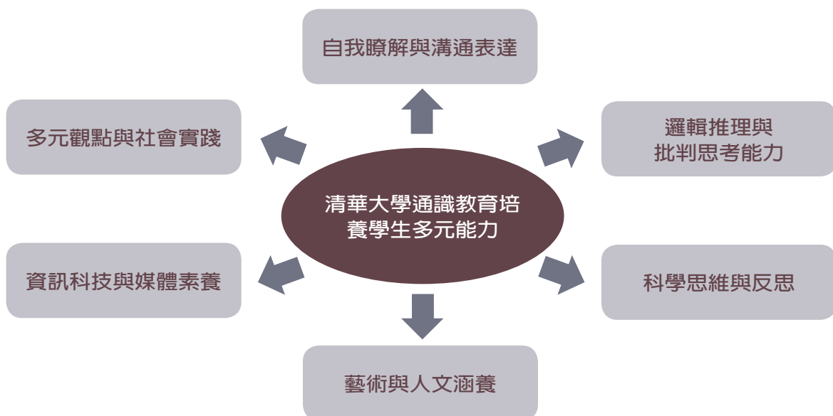
圖二 通識教育培養學生多元能力示意圖

（一）第一階段為探索期（1980-1989） ：在當年教育部訂定既有的共同科目外，開始增設通識教育課程。在本探索期，本校的通識課程變動非常快速，自1984至1986年三個學年度當中，有三次通識課程的提出與調整。有關這三次的課程課目分