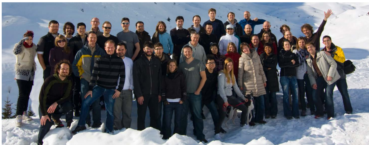
圖二：於 2012 年拍攝的瑞士蘇黎士聯邦理工學院 Aebersold 教授研究成員合照。

拓者之一。2015年8月，他的實驗室網頁的成員，共列出19位博士後研究員、6位博士生、2位博士級資深科學家。圖二是於2012年拍攝，並示於研究網頁上的研究成員合照。